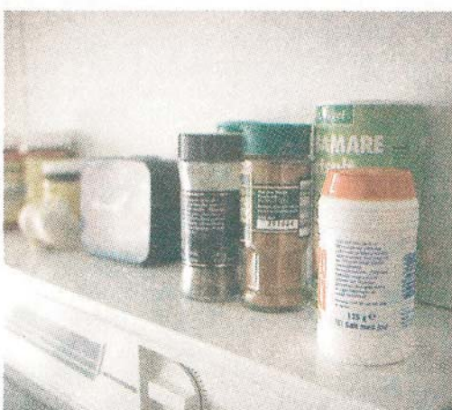
Lasse gillar att laga mat...