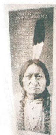
...naturfolk värda beundran.