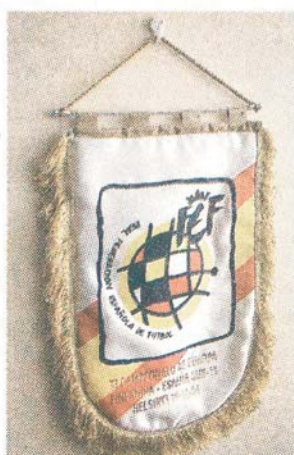
...minne från en match...