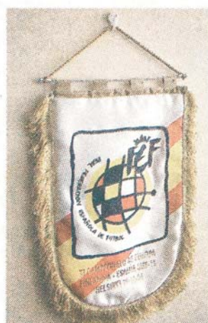
...minne från en match...